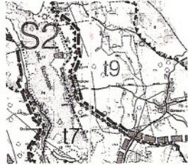
Szkic orientacyjny Skala 1: 15000

WYWEYS ZE STUDIUM UWARUNKWAŃ I KIERUNKÓW ZAGOSPODAROWANIA PRZESTRZENNEGO GMINY STARE JUCHY, UCHWAŁONEGO UCHWAŁĄ NR XXV/84/00 RADY GMINY STARE JUCHY Z DNIA 30.10.2000 R. Z PÓŻN. 2M.