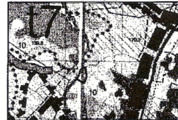
GRANICE TERENU OBJĘTEGO PROJEKTEM MIEJSCOWEGO PLANU ZAGOSPODAROWANIA PRZESTRZENNEGO